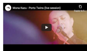
Porto Twins Réalisé par JB Fauconnier septembre 2020