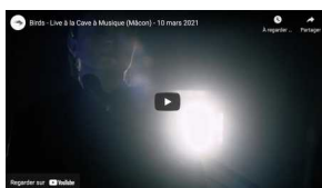
Birds Réalisé par Benjamin Chagneux mai 2021